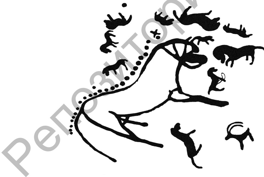
Рис. 2. Изображение коня

Особый интерес вызывает изображение коня на местонахождении Теректи Аулие 4, занимающего центральное место в композиции, расположенной на плоской горизонтальной плите, чуть наклоненной к югу. Это изобразительное панно расположено в 1,5 км к западу от основной гряды гранитных сопок. Размеры рисунка: длина 1,5 м, высота 1 м. Фигура коня ориентирована на восток. Рисунок полностью соответствует основному канону изображения лошадей на святилище Теректи Аулие, но содержит больше натуралистических деталей: тело с двумя короткими и чуть скошенными вперед ногами; прорисованы суставы и копыта; выгнутая линия спины; мощная шея; массивная голова с низко нависающей закругленной челкой опущена; на морде видны элементы узды; показаны уши; тонкий, довольно длинный хвост отведен от тела; подчеркнут крупный напряженный фаллос. Все детали прорисовки коня позволяют охарактеризовать его динамичную позу как готовность к совокуплению. 25 лунок различного диаметра (от 4 до 7 см) и глубины (от 0,5 до 1,5 см), выбитые над изображением жеребца, от середины гривы до хвоста, повторяют выгнутую линию спины животного. Над головой (между первой и второй лунками) вписан крест. Аналогичный крест расположен над изображением в 1,5 м выше по плите. Изображение коня окружено более мелкими рисунками очень плохой сохранности. Это изображения лошадей, горного козла и неопределенных животных, ориентированных в разные стороны и расположенных хаотично, бессистемно (рис. 2).