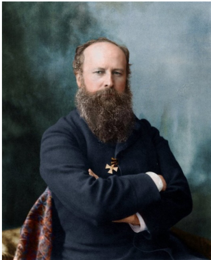
В.В. Верещагин (1842–1904)

Оңтүстік Қазақстан және Жетісу бейнесі «Туркестан. Этюд с натуры», «Очерки, наброски, воспоминания» атты иллюстрациялық кітаптардың және «Туркестанские серии» картиналарының авторы, орыс суретшісі В.В. Верещагиннің (1850–1935) туындыларында орын алған.