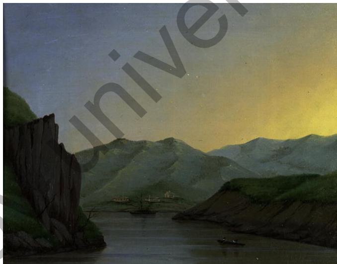
Бұқтырма бекінісі мен Өскемен қаласы арасындағы Ертіс өзені

1857 жылы танымал саяхатшы П.П. Семеновтың басшылығымен Тянь-Шаньның таулы жүйесін зерттеу бойынша Орыс географиялық қоғамының ғылыми экспедициясы құрамында суретші ретінде қатысты. Алтай, Тарбағатай, Семей қаласы, Жетісу мен Іле Алатауы, Шелек пен Меркі өзендеріне, Балқаш көліне барды [7]. Сапар нәтижесінде Хан-Тәңірі тауының шыңы, жергілікті тұрғындардың портреттері, тарихи ескерткіштер, тұрмыстық бұйымдар мен киім-кешектер суреттері секілді туындылар дүниеге келіп, олардың бір бөлігі болашақта суретшінің «Виды природы в Тянь-Шане. Его жителей Дико-Каменных и Большой Орды киргизов» атты этнографиялық альбомына енді [8; 33–39; 9; 147–193].