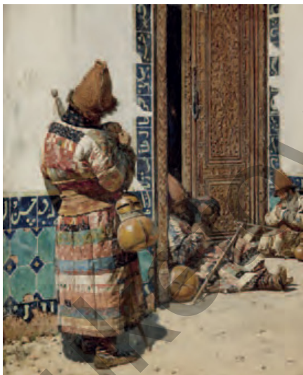
Мешіт есігінің алдында