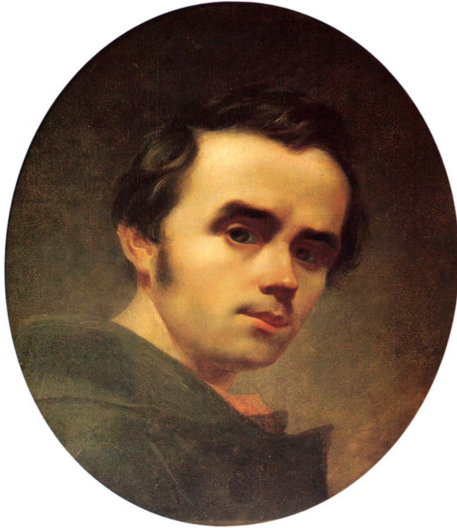
Т.Г. Шевченко (1814–1864)