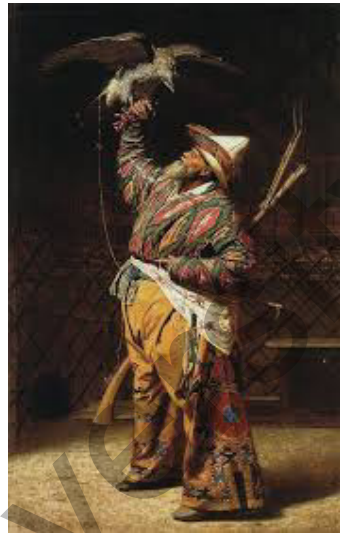
Бай қырғыз (қазақ) аңшысы сұңқармен