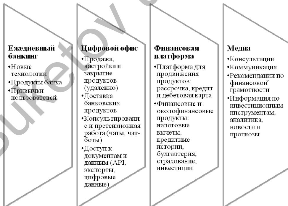
Рисунок 2. Бизнес модели цифрового банкинга

Развитие цифрового банкинга основывается на развитии 4 основных бизнес моделей, таких как ежедневный бандинг (ежедневные задачи и потребности клиента, связанные с получением необходимой информации по продуктам и услугам банка, а также возможность клиента совершать платежные и переводные операции), цифровой офис (возможность удаленно получать необходимые банковские услуги/продукты), финансовая платформа (платформа электронной коммерции и оказания финансовых и околофинансовых услуг) и медиа платформа (система коммуникации).