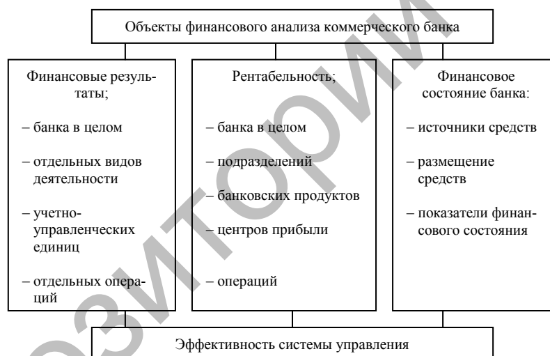
Рисунок 2. Состав основных объектов финансового анализа в банке

Объектами финансового анализа в банке, прежде всего, могут быть показатели финансовых результатов, результативности и финансового состояния банка, показатели эффективности системы финансового управления, банковских услуг, операций, технологий, систем финансовой безопасности и др. По мере углубления анализа объекты его детализируются (рис. 2).