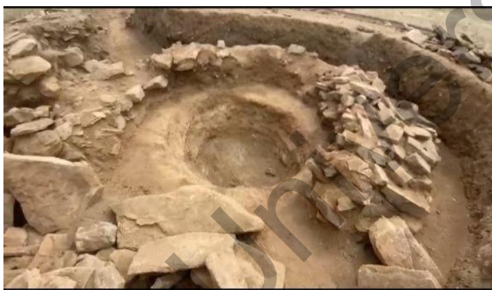
3-сурет. Жанбөбек археологиялық кешенінің жалпы көрінісі