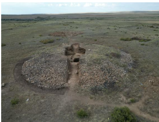
1-сурет. Ұлытау-2 археологиялық кешенінің жалпы көрінісі

шұңқырының диаметрі 1,3 м. Қабір шұңқырының көлемі: шығыстан батысқа ұзындығы 4 м, оңтүстіктен солтүстікке ені 2,3 м. Қабір шұңқырының тереңдігі шамамен 3 м құрады.