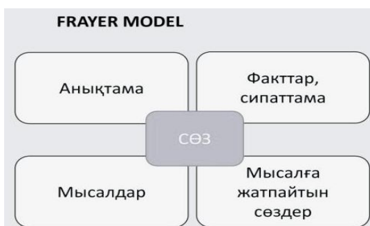
1-сурет. Негізгі ұғымдар мен сөздердің мағынасын ашуға қолданылатын кесте.

Қазақ тілінен грамматиканы саналы түрде меңгеруі үшін сөздердің, сөйлемдердің немесе сөйлем мүшелері мен сөз таптарының өзара ұқсастығы мен өзгешеліктерін, фонетикалық, морфологиялық белгілерін салыстыра алудың маңызы зор. Мысалы, «Фрейер моделі» бұл техника негізгі ұғымдар мен сөздердің терең мағынасын түсіне білуге, сыни тұрғыда ойлауға, ұғымдар арасында байланыс орнату үшін алдыңғы білімге сүйенуге, тест немесе куйз алдында сөздерді қайталауға қолданылады. Грамматикалық ұғымдар мен құбылыстардың ерекшеліктеріне талдау жасай отырып, олардың негізгі белгілерін ажыратады (1-сурет).