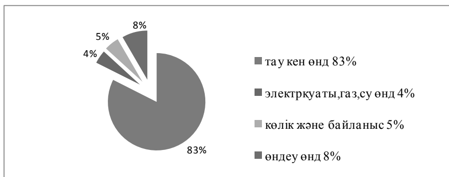
Сурет 1. ҚР-на қызметтер нысандары бойынша шетел инвестицияларының 2015 жылғы келіп түсуінің салмақ үлесі

Бірақ қазіргі уақытта шетелдік инвестицияның басым көпшілігі еліміздің шикізаттық қорын игеруге салынып отыр. ҚР-ң Статистика агенттігі көрсеткендей, негізгі капиталды инвестициялау негізінен шикізаттық салаларға тартылуда. Бүгінде шетел инвестицияларының 80% шикізаттық өндіріске салынуда.