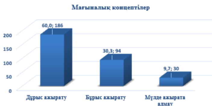
2-сурет. Мақалдарды «Ұят болмасын», «Жаман болмасын», «Обал болмасын» концептілеріне сай жіктеу

Мақалдың эмотивтік деңгейін анықтау үшін, жастардың санасында қандай астарлы ой тудыратындығын нақтылау мақсатында алынған жауаптың сандық нәтижесі бойынша респонденттердің 56.77 пайызы (176 студент) «ұят» категориясына сай мағынасын ашты. 20.97 %, яғни 65 студент мақалдың мазмұнын аша алмады, келесі 69 студент (22.26 %) басқа нұсқаларды атады.