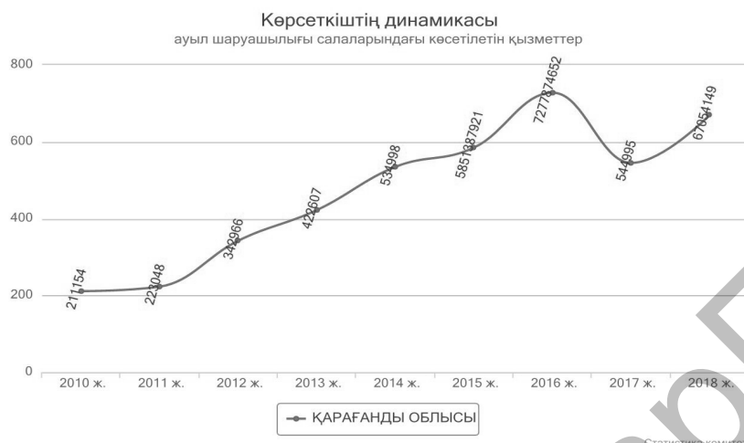
2 сурет. Қарағанды облысы бойынша ауылшаруашылығында көрсетілетін қызметтер динамикасы

Осыған орай, Қарағанды облысының ауыл шаруашылығы салаларындағы көрсетілетін қызметтер динамикасы төмендегі суретте көрсетілген (2 сурет)