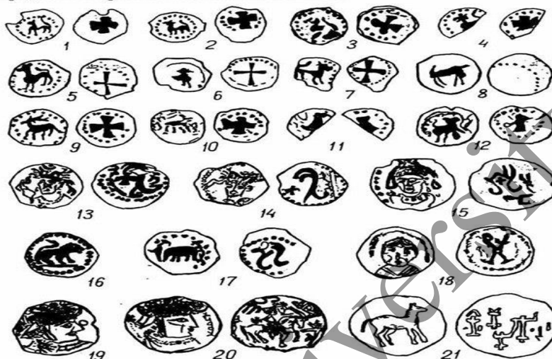
Таблица 1 Монеты: 1 — 12-Западного Согда. 4 — 6 вв.; 13 — 14, 17 — Уструшаны. 6 в.; 15 — Восточного Согда. 6 в.; 16 — из Отрара. 7 — 8 вв.; 19 — 20 — из Хорезма. 8 в.; 21 — монета с озера Челкар. 6 в.

В сасанидском Иране, несмотря на периодические гонения, несториане часто занимали высокие государственные должности, были чиновниками, известными врачами, специалистами в различных областях техники. По большим караванным путям шла широкая и настойчивая миссионерская деятельность несториан. Великим шёлковым путём пошли они в Согд и Бактрию, бассейн Сырдарьи и Семиречье [4, с. 12]. В Бухаре и Самарканде, в крупнейших центрах несторианства, религия возможно могла влиять на правящие круги и даже становиться государственной религией. Например, большое количество найденных монет с христианской символикой, особенно в районе Бухары и Западного Согда, позволяет предположить, что христианство могло быть официальной религией одного из княжеств региона и развитие монетных дворов на этих территориях.