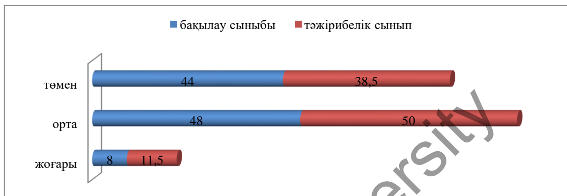
1-сурет. Анықтау кезеңіндегі екі сыныптың көрсеткіштері

Кестедегі көрсетілген нәтижелердің салыстырмалы көрсеткіштерін диаграмма түрінде ұсынамыз (1-сурет).