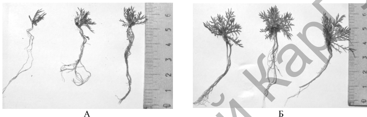
Рис. 2. Внешний вид ювенильных растений сортов Chamomilla recutita : А — сорт Карагандинская; Б — сорт Подмосковная

Раскрытие настоящих листьев наблюдается одновременно у двух сортов, первые настоящие листья появляются на 12–15-й день у испытуемого сорта, у стандарта на 16–18-й день при подзимнем сроке посева с момента появления массовых всходов. В течение последующих дней происходит дальнейшее развитие и рост листьев (рис. 2).