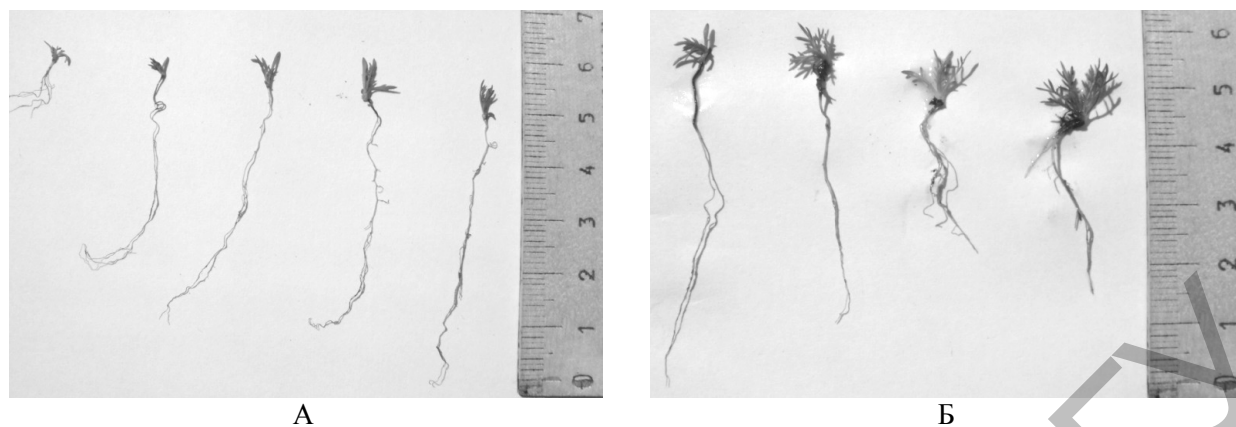
Рис. 1. Внешний вид проростков сортов Chamomilla recutita : А — сорт Карагандинская; Б — сорт Подмосковная