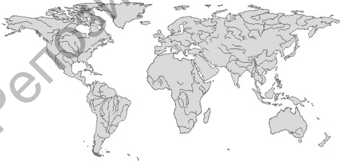
Рисунок 2. Отцифрованные контуры рек

Следующим этапом являлась отцифровка речной сети. Для контуров рек был задан линейный тип изображения (рис. 2).