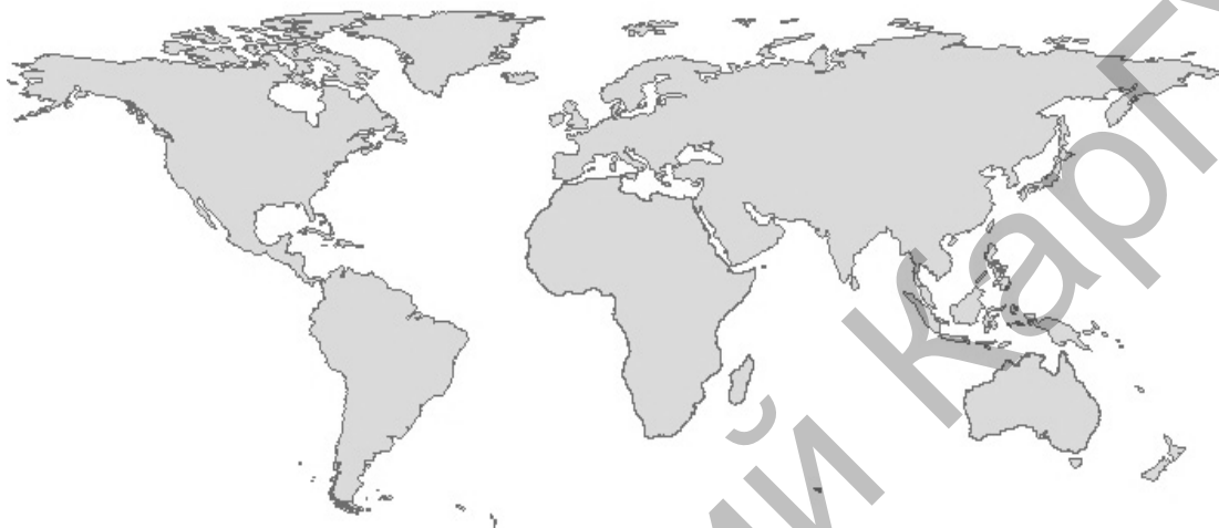
Рисунок 1. Отцифрованные контуры суши

Основной метод создания электронных карт — математико-картографическое моделирование содержания, нагрузки и условных знаков с использованием визуальной оценки получаемого изображения. Созданные карты выглядят так: слой суши, который отображает отцифрованный контур материков и островов (рис. 1).