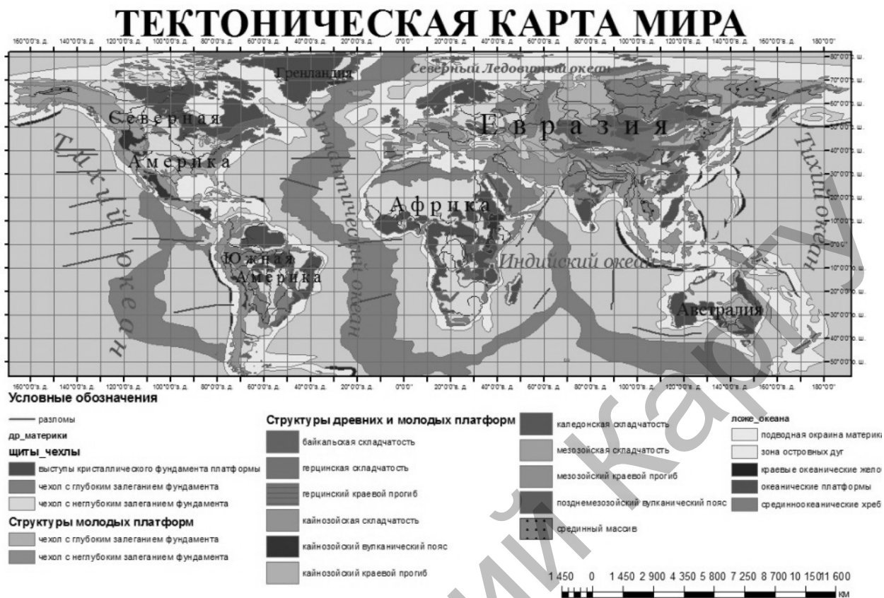
Рисунок 4. Тектоническая карта мира

На рисунке 4 изображены области складчатостей, краевые прогибы, платформенные чехлы, выступы кристаллического фундамента, молодые платформы, зоны островных дуг, подводные окраины материков, океанические платформы, срединноокеанические хребты, краевые океанические желоба.