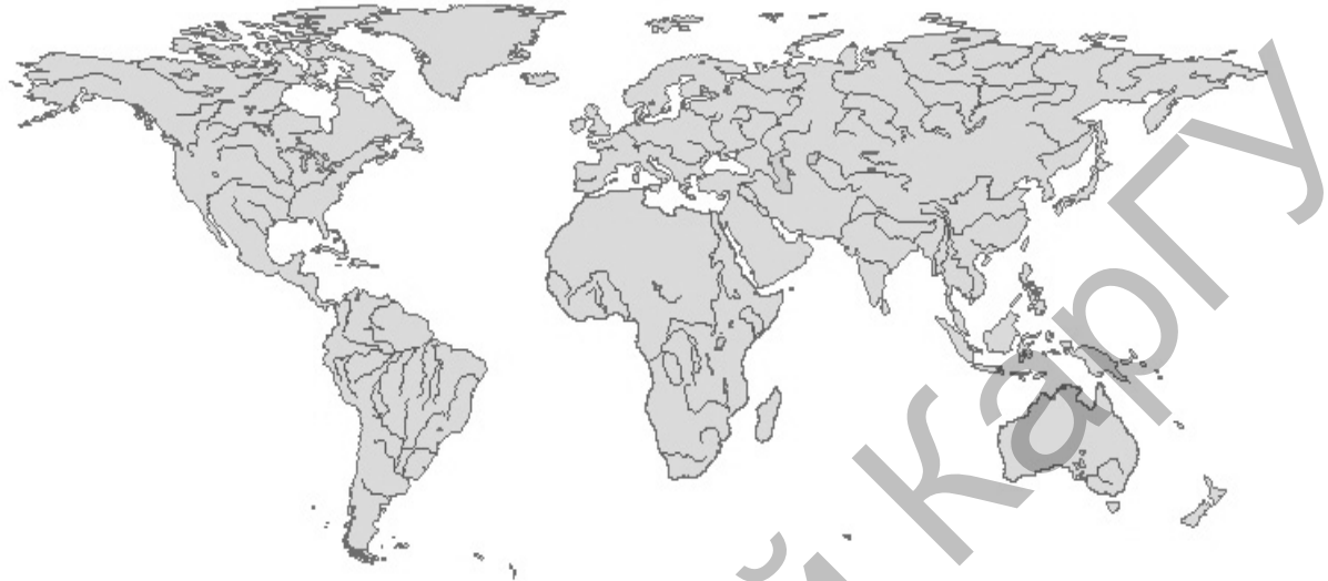
Рисунок 3. Отцифровка крупных озер

Следующим этапом являлось отображение некоторых крупных озер (рис. 3).