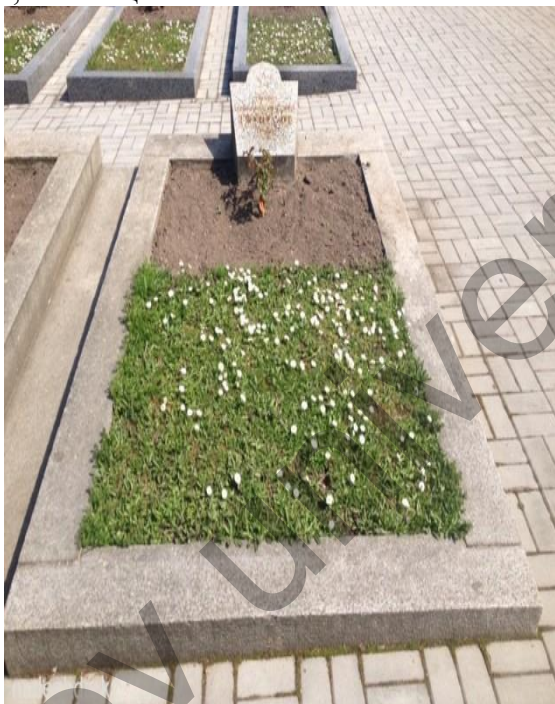
3-сурет. Прагадағы Ольшан қорымындағы суреті