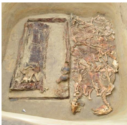
1-сурет. Берел қорғаны 2, б.з.б IV-III ғасырлар