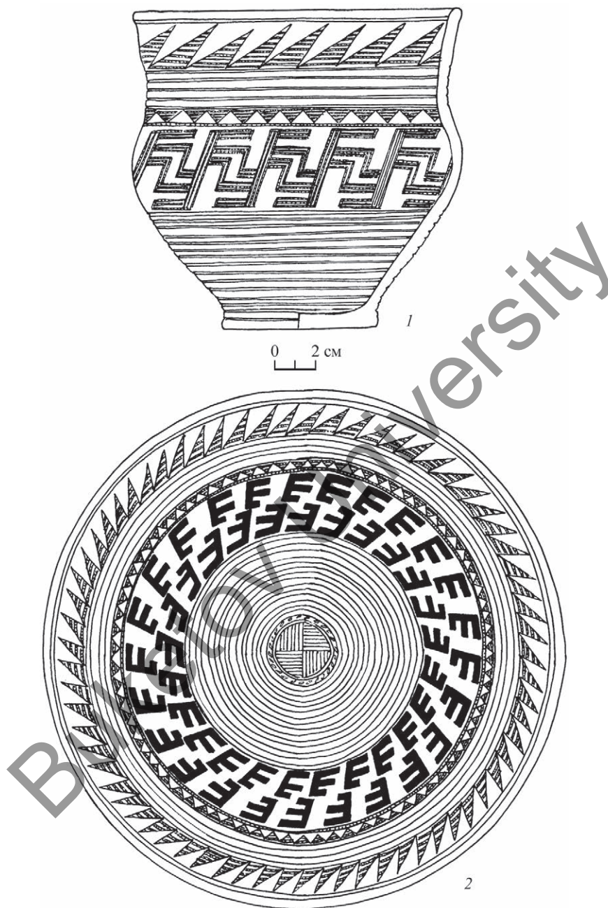
Рис. 3. Свастические элементы орнамента

1, 2 – керамический сосуд и круговая развертка орнамента на нем со схематичным изображением лошадей. Могильник Лисаковский I, Северный Казахстан (по: Усманова, 2005)