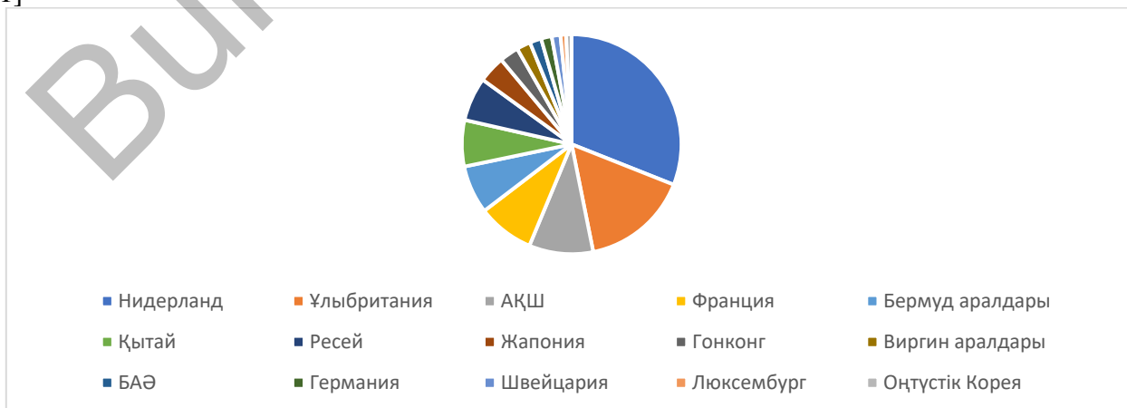
2 - сурет. Қазақстанның қарызы бар елдер.