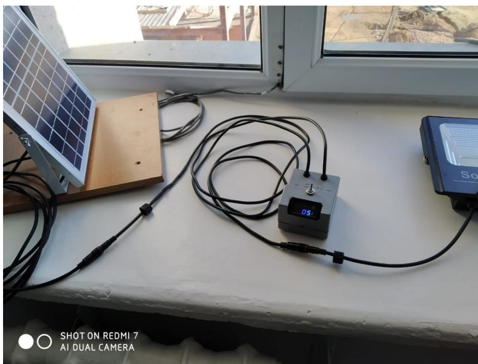
Рисунок 1. Лабораторный стенд для студентов

Для измерения напряжения и освещённости на солнечных панелях в зависимости от установочного угла солнечных панелей, создан лабораторный стенд (Рисунок 1). В ходе измерительных работ зависимость изменения напряжения без нагрузки и с нагрузкой.