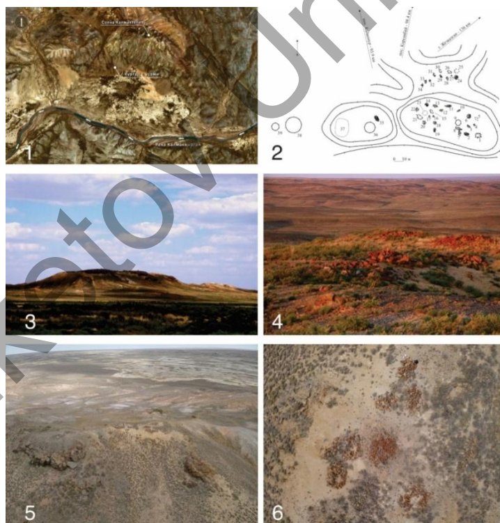
1-сурет. Қалмақтөбе шоқысының археологиялық зерттеулері

Қалмақтөбе ауданының геоморфологиялық құрылымында рельефтің келесі түрлері бөлінеді: эрозиялық-тектоникалық жота-қыратты ұсақ шоқылар мен эрозиялық өзен маңы ұсақ шоқылары; Қалмаққырған өзені аңғарының арнасы, жайылымы және бірінші жоғары жайылма террасасы [7]. Биіктігі 35 м-ге дейін абсолютті белгілері бар эрозиялық-тектоникалық жота-қыратты ұсақ шоқылар ауданның көп бөлігінде таралған және оның солтүстік бөлігін түгелдей дерлік алып жатыр, өзен аңғарының ең кең учаскесін қоршап жатыр. Ол Қалмақтөбе шоқысымен және одан солтүстікте орналасқан бірнеше төменірек шоқылармен ұсынылған [4; 73-74]. Қалмаққырған өзенінің аңғарының өзінде сақталған тоғандары бар арна, тар жайылым және биіктігі 5 м-ге дейінгі, құмдауыт-сазды материалдан тұратын бірінші жоғары жайылма террасасы бөлінеді. Қалмақтөбе шоқысы орналасқан жердегі терраса ені айтарлықтай үлкен және шамамен 200 м-ге жетеді. Өзен арнасы мұнда қалың қамыспен қалың өсіп, балыққа бай үлкен терең тоғандарды құрайды [4; 75].