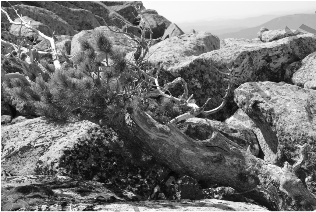
Рисунок 4. Погибший кедр на вершине Тигирекского хребта

На вершинах Тигирекского хребта мы можем видеть хорошо сохранившиеся фрагменты деревьев, погибших во время Малого ледникового периода (рис. 4). Это еще один источник информации о динамике ландшафтов в прошлом. Кстати, многие путешественники, посещавшие Алтай в конце XVIII – первой половине XIX в., отмечали обилие погибших взрослых деревьев на вершинах горных хребтов, в том числе в Северо-Западном Алтае, где сейчас расположен Тигирекский заповедник. Так, на этот факт указывают члены экспедиции, организованной Дерптским университетом в 1826 г., К.Ф. Ледебур и А.А. Бунге. Оба естествоиспытателя неоднократно упоминают в своих дневниках об увиденных ими случаях массовой гибели леса, рассуждая о причинах этого и недоумевая, что они являются свидетелями глобального похолодания [25].