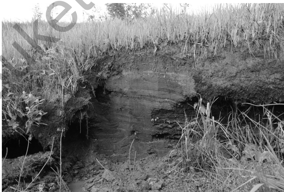
Рисунок 3. Торфяник в Тигирекском заповеднике