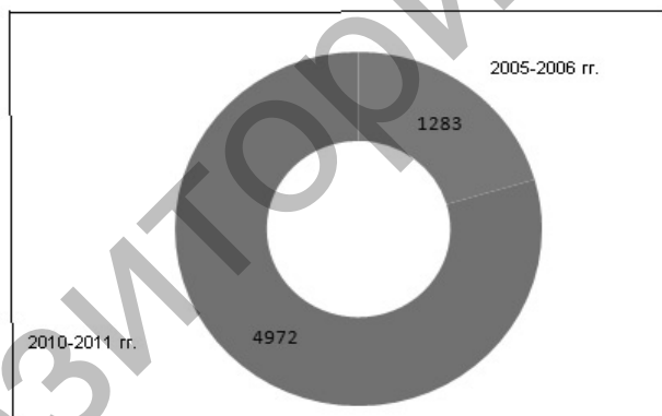
Рисунок 2. Основные статистические показатели системы дошкольного образования на 2006–2011 гг.

Сегодня в республике 4972 дошкольных организаций, из них 2003 детских сада (рис. 2). Охват детей дошкольным воспитанием и обучением составляет 373160 человек, или 38,7 % от числа детей дошкольного возраста. В городе имеется 908 ДО, что на 29 ед. больше, чем в 2004 г., на селе — 375 ДО, что на 58 ед. больше, чем в 2004 г. Сеть дошкольных организаций по сравнению с 2004 г. увеличилась на 88 единиц, контингент — на 16,6 тыс. детей. Охват детей дошкольного возраста детскими садами в среднем по стране вырос на 2,5 % и составляет 23,2 %.