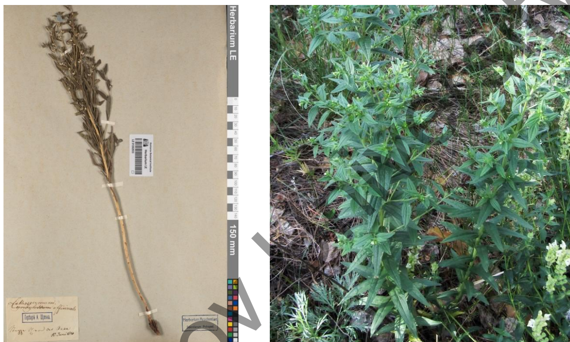
Рисунок 1. Lithospermum officinale L., Воробейник лекарственный (слева — из Коллекции LE; справа — фото цветущего растения. Восточный Казахстан, Кокпектинский р-он. https://www.plantarium.ru/page/image/id/486538.html )