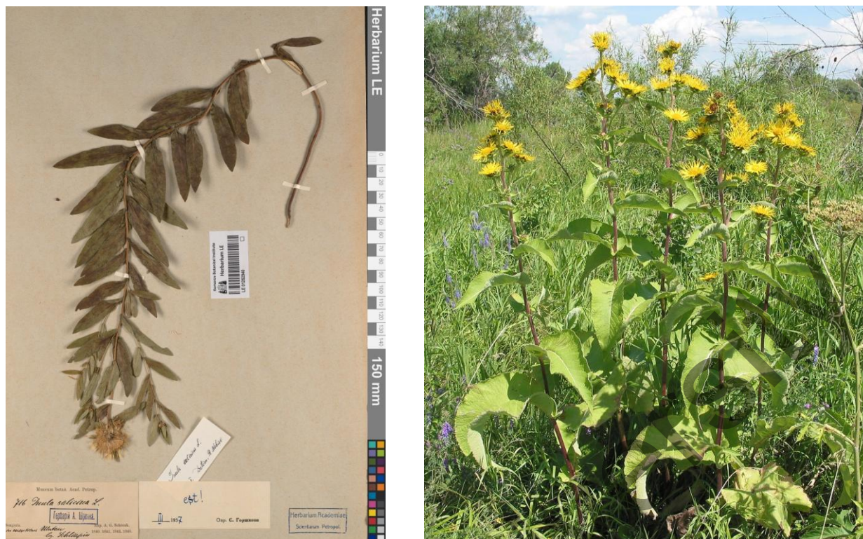
Рисунок 4. Inula salicina L.

(слева — из Коллекции LE; справа — фото Inula helenium L., цветущее растение с коричневыми стеблями. Восточный Казахстан. https://www.plantarium.ru/page/image/id/233884.html )