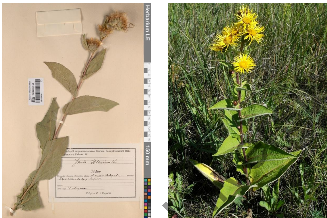
Рисунок 3. Inula helenium L., Девясил высокий (слева — из Коллекции LE; справа — фото растения. Северо-восточная окраина г. Караганды, низина вдоль железной дороги. https://www.plantarium.ru/page/image/id/665962.html )

Упомянутое в словаре Н.И. Анненкова слово «карандыс» в Казахско-русском словаре обозначено как «кара андыз» и относится к Inula helenium L., девясилу высокому (рис. 3).