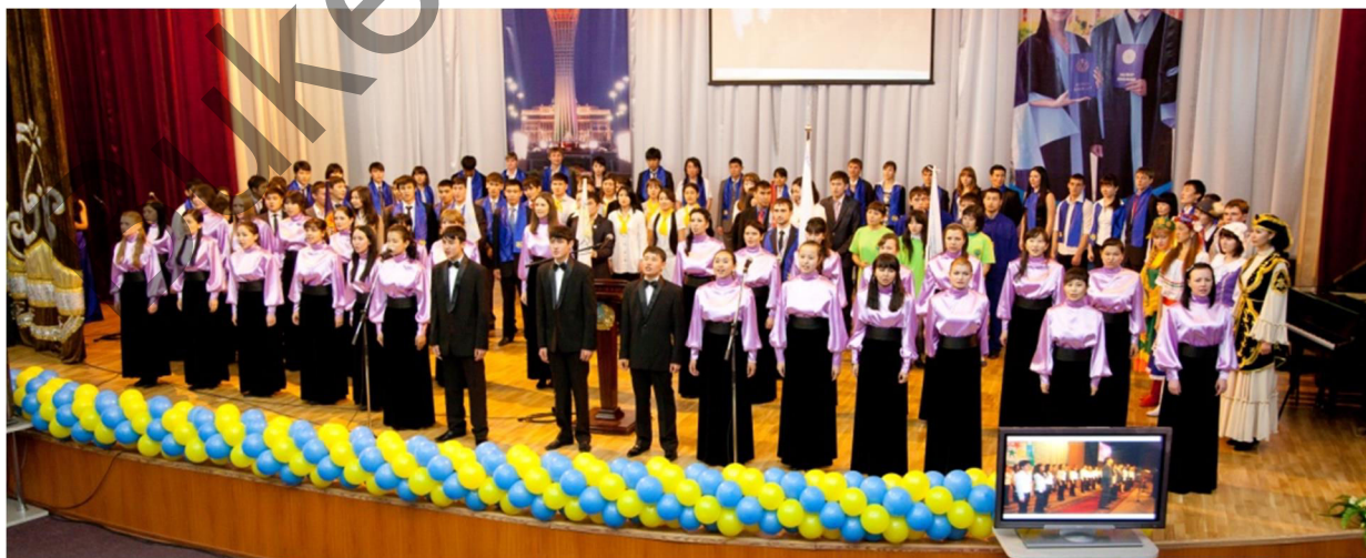
Рисунок 1. Студенческий хор Дворца студентов Карагандинского университета им. Е.А. Букетова