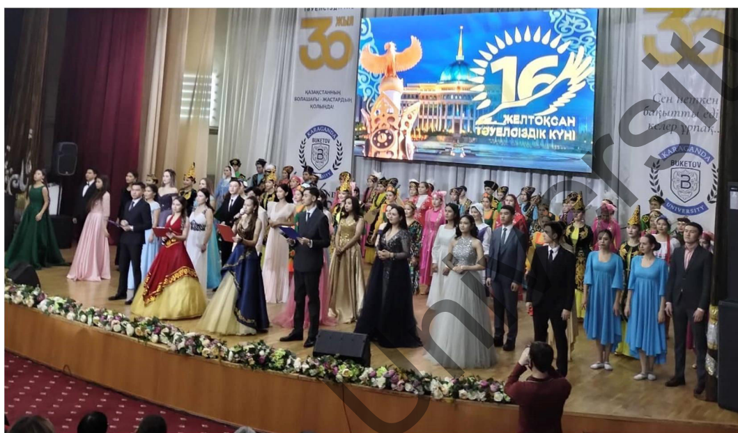
Рисунок 2. Выступление вокально-хоровой студии Дворца студентов Карагандинского университета им. Е.А. Букетова в сводном праздничном концерте

колледжа искусств, вузов. В условиях практической работы с участниками вокально-хоровой студии – солистами, вокальными ансамблями, хоровыми составами – студенты-практиканты имеют возможность закрепления полученных теоретических знаний, формирования практических навыков и компетенций вокально-хоровой работы с самодеятельными исполнителями и коллективами, совершенствовать свои организаторские, управленческие, дирижёрские, хормейстерские навыки.