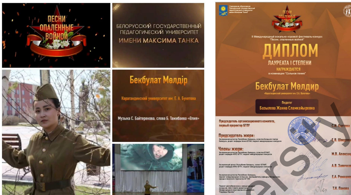
Рисунок 3. Участие в Международном онлайн-конкурсе «Песни, опалённые войной», посвящённом Дню Победы (г. Минск, БГПУ им. М. Танка)

В организации деятельности вокально-хоровой студии важную роль сегодня играют специальные веб-сайты и социальные сети. Так, информация о деятельности вокально-хоровой студии Дворца студентов Карагандинского университета им. Е.А. Букетова размещена на официальном сайте вуза [11] (рисунок 4), а также на страницах университета в социальных сетях.