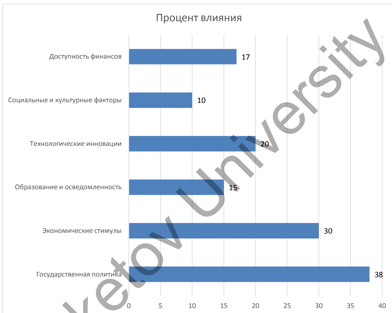
Диаграмма 1. Процент влияния и регулирования

Государственная поддержка важна для улучшения экологических стандартов посредством законодательства, грантов и правоприменения. В ЕС действуют такие политики, как «зеленый курс» и Общая сельскохозяйственная политика, которые направлены на устойчивое развитие сельского хозяйства. В 2020 году 38 % бюджета ЕС было выделено на экологическую политику (1,08 миллиарда евро). В Соединенных Штатах субсидии фермерам, отвечающим экологическим стандартам, к 2022 году достигнут 7 миллиардов долларов. В Китае были введены новые экологические требования к сельскому хозяйству; в результате уровень загрязнения снизился на 15-20%. Этот пример показывает, насколько важна государственная поддержка в вопросе экологической устойчивости (диагр. 1).