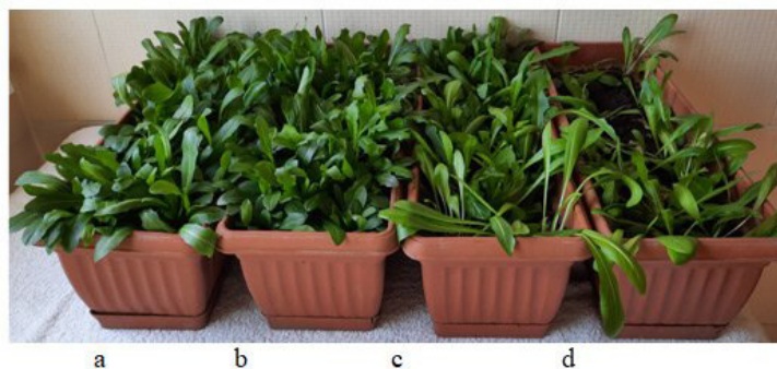
Рисунок 2. Сеянцы T. kok-saghyz на образцах почвы: a — «Кегень»; b — «Сарыжаз»; c, d — на торфогрунте «Фаско». Пятый месяц развития сеянцев, виргинильные особи

Результат 3. На торфогрунте «Фаско» сеянцы T. kok-saghyz активно развиваются первые четыре месяца. Однако на пятый месяц сеянцы на торфогрунте «Фаско» отстают в развитии, 52–64 % растений отмирает. По биомассе листа 3 \pm 1 грамм сеянцы на торфогрунте «Фаско» меньше в сравнении с сеянцами на образцах почв in situ популяций кок-сагыза «Кегень» 8 \pm 1 грамм в 2,6 раза и Сарыжаз 5 \pm 1 грамм в 1,6 раза (рис. 2).