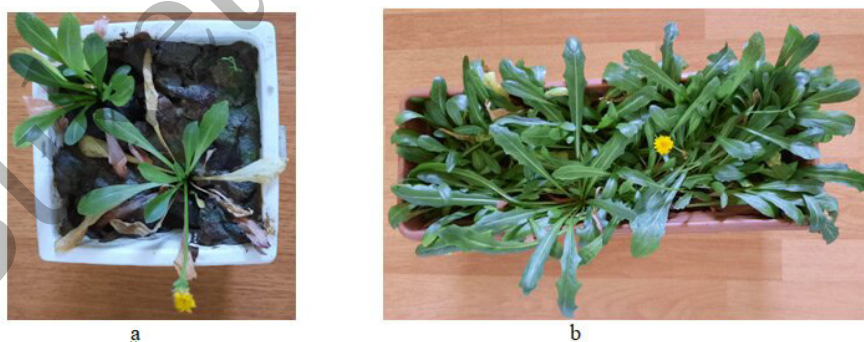
Рисунок 6. Цветение сеянцев T. kok-saghyz на образцах почв: a — «Соленое озеро»; b — «Сарыжаз», шестой месяц развития сеянцев, возрастное состояние: генеративные молодые особи

В условиях теплицы на испытанных образцах почв in situ популяций T. kok-saghyz , сеянцы цветут на шестой месяц развития, то есть достигают фазы онтогенеза генеративные молодые растения (рис. 6). Для прорастания семян, роста, развития сеянцев на почвах in situ популяций T. kok-saghyz удобрения, торфяные таблетки не требуются.