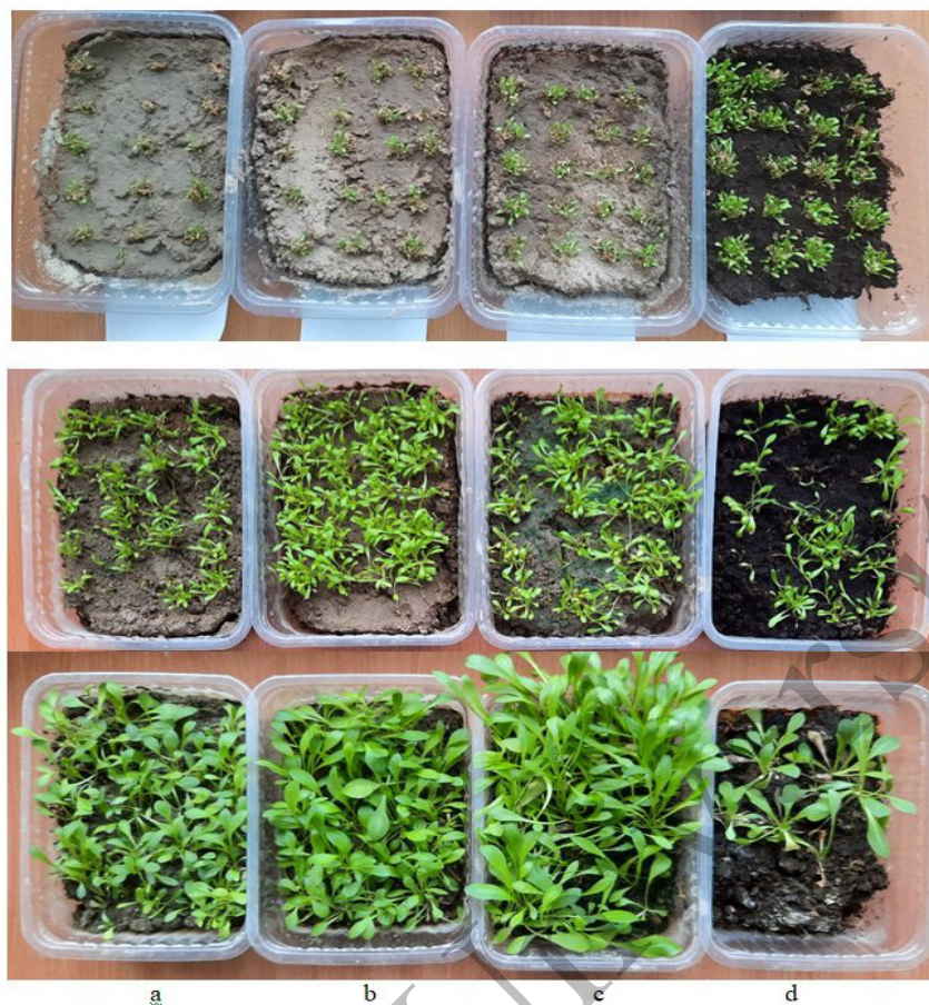
Рисунок 1. Развитие сеянцев T. kok-saghyz на образцах почвы: a — «Соленое озеро»; b — «Сарыжаз»; c — «Кегень»; d — коммерческий универсальный торфогрунт «Богатырь». Верхний ряд на 9-е сутки, средний ряд на 27-е сутки, нижний ряд на 57-е сутки после сева

Таким образом, можно заключить, что торфогрунт «Богатырь» мало пригоден для получения рассады T. kok-saghyz . Вероятно, это связано с низким содержанием фосфора. Так, в торфогрунте «Богатырь» содержание макроэлементов следующее: N — 300, P — 30, K — 400 мг/л. В связи с этим в настоящей работе использован торфогрунт «Фаско» с относительно высоким содержанием фосфора, с содержанием макроэлементов: N — 350, P — 400, K — 500 мг/кг.