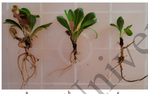
Рисунок 5. Сеянцы T. kok-saghyz на образцах почвы: a — «Кегень»; b — «Сарыжаз»; c — «Соленое озеро», четвертый месяц развития сеянцев; возрастное состояние: четвертый месяц развития сеянцев, иматурные особи

В условиях теплицы на испытанных образцах почв in situ популяций T. kok-saghyz , сеянцы цветут на шестой месяц развития, то есть достигают фазы онтогенеза генеративные молодые растения (рис. 6). Для прорастания семян, роста, развития сеянцев на почвах in situ популяций T. kok-saghyz удобрения, торфяные таблетки не требуются.