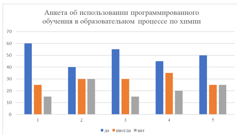
Диаграмма 2. Результаты анкетирования об использовании программированного обучения

Таким образом, нами были разработан контент программированного тренажера по 4 темам 8 и 10 класса. Эксперимент с участием 8-х и 10-х классов доказал, что использование программированного обучения: