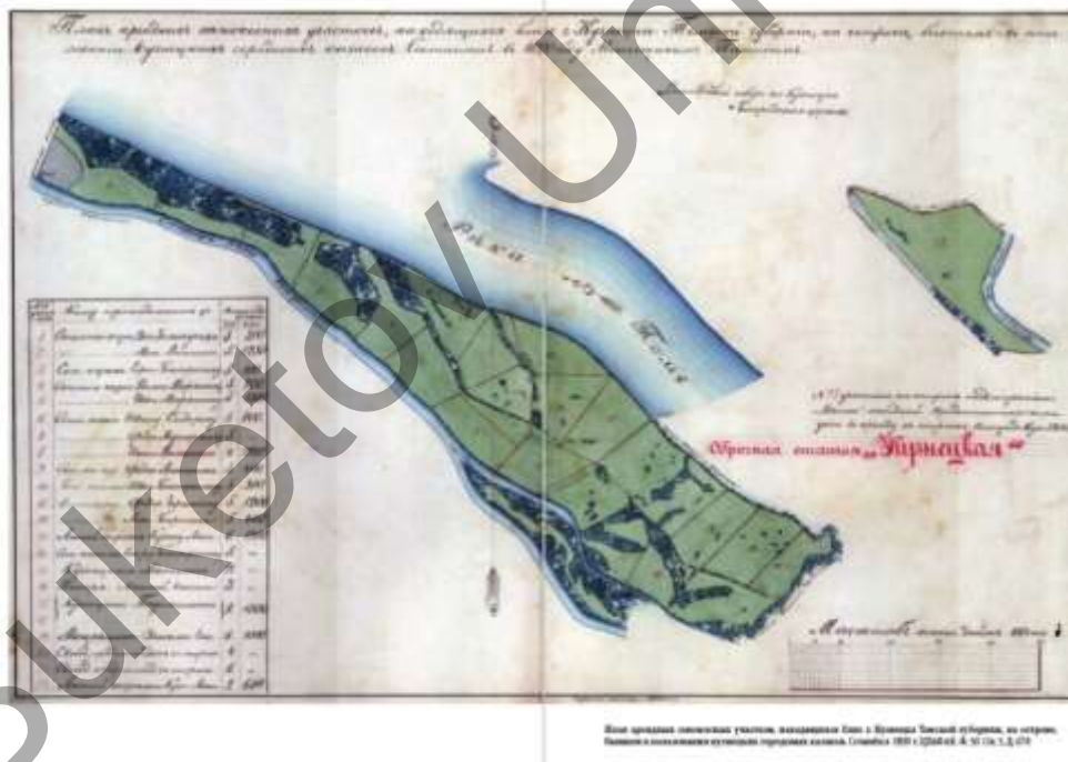
Рисунок 2. План арендных сенокосных участков, находящихся близ г. Кузнецка Томской губернии, 1890 г. [3]

Ландшафты заливных лугов с высокотравьем в левобережье р. Томь (рис. 2) использовались в качестве естественных сенокосных угодий [2]. Итогом данного периода стало заложение градоформирующих элементов города Кузнецка: Кузнецкая крепость, Казачий форштадт. Характерная схема освоения территории города в этот период — «сектор» — каркасное освоение территории первого сектора — между большой и малой реками.