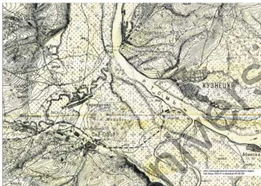
Рисунок 3. Карта Кузнецкого округа Сибирского края, 1926–1927 гг. [3]

2.3. 1920–1949 гг. — период освоения территории дальнего заречья — за большой р. Томью (территория левобережья — Верхняя и Нижняя колонии, «Сад-город», «Соцгород»). Период характеризуется регулярной планировкой центра, а также появлением третьего планировочного модуля. Непосредственно в это время происходило освоение территории за большой рекой Томью — территории исторического левобережного района («Соцгород») и его дальнейшее постепенное развитие вдоль радиальных направлений: «Соцгород» — система радиальных направлений от градоформирующих функциональных центров между малой рекой Абой и рекой Кондомой. Схема освоения—«кольцо»—освоение «заречья» за большой рекой (рис. 3).