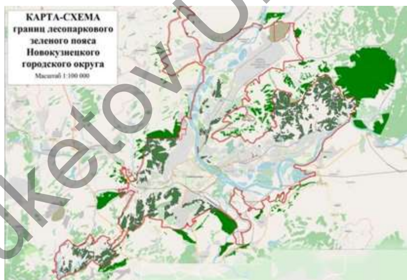
Рисунок 4. Карта-схема границ лесопаркового зеленого пояса Новокузнецкого городского округа, 2020 г. [8]

Новое строительство намечается частично на свободных, частично на реконструируемых территориях. Зона индивидуальной (усадебной и коттеджной застройки) с минимальным ущербом охватывает природное окружение и включает в себя существующую сохраняемую и новую усадебную застройку. Зона размещается преимущественно в южном направлении от центра города. Расширяется территория города и устанавливается статус Новокузнецкого городского округа, обсуждается создание лесопаркового зеленого пояса (рис. 4). Постановлением Законодательного собрания Кемеровской области — Кузбасса от 23 сентября 2020 г. принято Решение «О создании лесопаркового зеленого пояса Новокузнецкого городского округа и о его площади» [7].