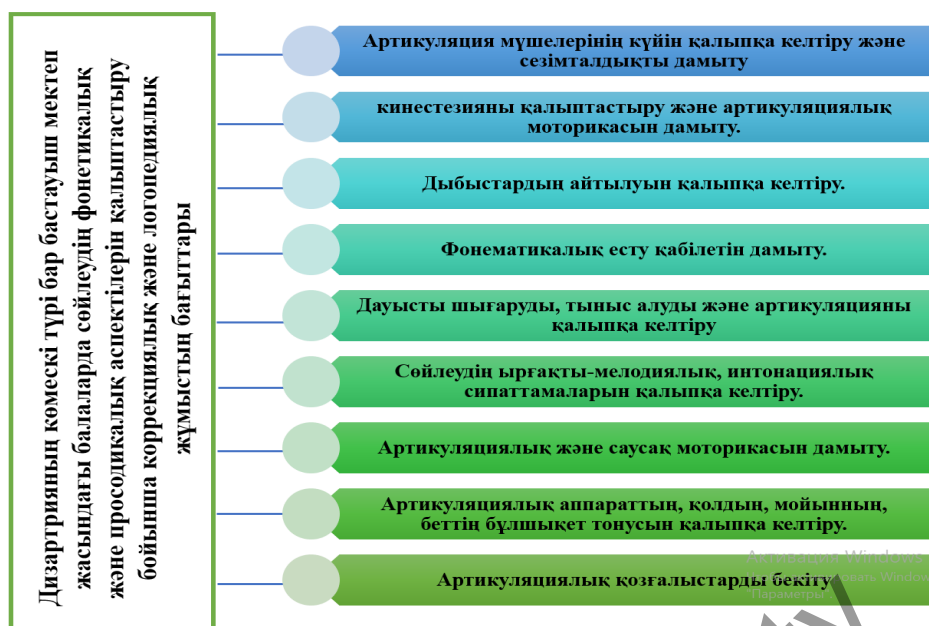
Сурет 3. Дизартрияның көмескі түрі бар бастауыш мектеп жасындағы балаларда сөйлеудің фонетикалық және просодикалық аспектілерін қалыптастыру бойынша коррекциялық және логопедиялық жұмыстардың бағыттары.

Қорытындылай келе, дизартрияның жасырын түрі үшін логопедиялық жұмыс әртүрлі сөйлеу және қозғалыс бұзылыстарын жоюға, сондай-ақ баланың жеке басының жалпы дамуына бағытталған деп айта аламыз. Оң нәтижеге қол жеткізу үшін медициналық, психологиялық, педагогикалық және логопедиялық әдістерді қамтитын кешенді тәсіл негіз болып табылады. Балалардың жас және жеке ерекшеліктеріне бағытталған сараланған әдістерді қолдану дыбыстың айтылуын тиімді қалыпқа келтіруге, фонематикалық қабылдауды дамытуға, артикуляциялық және саусақ моторикасын жетілдіруге, сөйлеу дағдыларын бекітуге мүмкіндік береді.