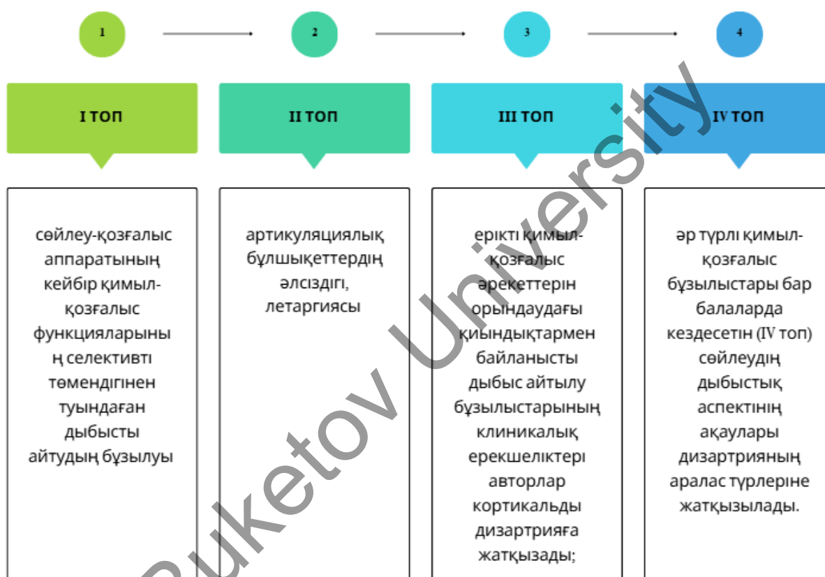
Сурет 1. Көмескі дизартрияның түрлері

Айтылу процесінің қозғалтқыш жағындағы бұзылулардың көріністеріне байланысты және артикуляциялық аппарат мүшелеріндегі паретикалық құбылыстардың локализациясын ескере отырып, авторлар балаларды төрт топқа бөліп, көмескі дизартрияның келесі түрлерін анықтады [1-сурет].