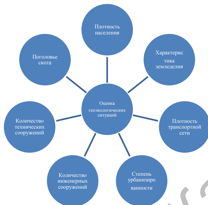
Рисунок 1 – Модель оценки геоэкологических ситуаций по потенциальному воздействию

Биогенные факторы определяются степенью сельскохозяйственного воздействия на водный и воздушный бассейны и почвы, которые проявляются в высоком уровне использования водных ресурсов на сельскохозяйственное водоснабжение и орошение, загрязнении водоёмов стоками животноводческих комплексов, локальном влиянии отходов животноводства на почвы и трансформации растительных сообществ.