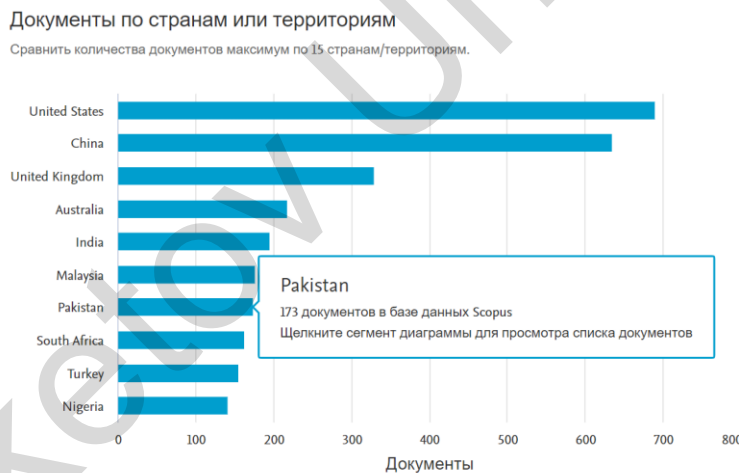
Рисунок 2. Научные литературы по странам/территориям

На рисунке 2 показано географическое распределение научной литературы по континентам в области исследования взаимосвязи между «экономическим ростом» и «инвестициями».