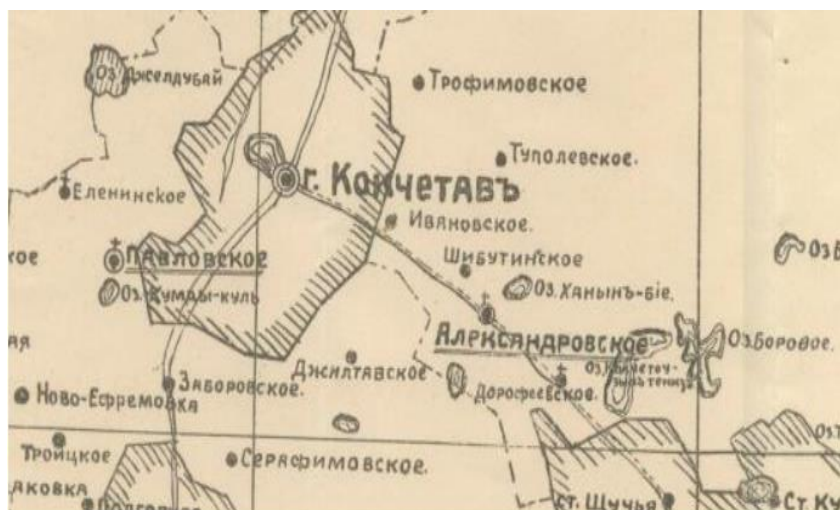
Изображение 1. Схематическая карта Кокчетавского уезда Акмолинской области 1912г[6]