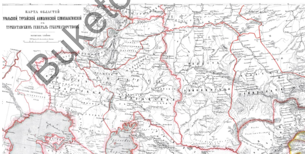
Изображение 3. Карта Акмолинской области 1968г[8].