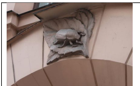
Рисунок 2. Барельеф майского жука на фасаде школы

С самого начала учебное заведение состояло из двух отделений. Дети, обнаружившие гуманитарные способности, обучались на Гимназическом отделении, на протяжении 10 лет. Эти гимназисты продолжали образование в Императорском государственном Санкт-Петербургском университете. Юноши, склонные к естественным наукам, учились на Реальном отделении в течение 8 лет, что позволяло им продолжать образование в технических вузах. Благодаря такой структуре официальным названием этого среднего учебного заведения с 1881 года стало «Гимназия и Реальное училище К. Мая».