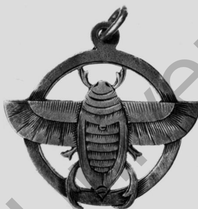
Рисунок 4. Майские жуки Рисунок 5. Юбилейный нагрудный знак выпусков 1906 и 1916 г.