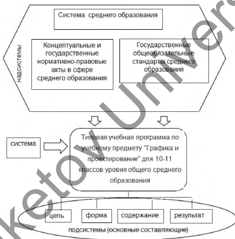
Рисунок 1. Визуализация системного подхода

Объект нашего исследования рассматривается как совокупность множества взаимосвязанных элементов, образующих определенную целостность и предполагающих взаимодействие элементов. Следовательно, необходим системный подход, при котором цель, форма, содержание и результат разработки типовой учебной программы по предмету — это подсистемы, которые нельзя рассматривать в изоляции друг от друга и формулировать в зависимости от желаний разработчика, без достаточного обоснования. В то же время нельзя игнорировать наличие надсистемы, устанавливающей выполнение многочисленных нормативно-правовых актов (рис. 1).