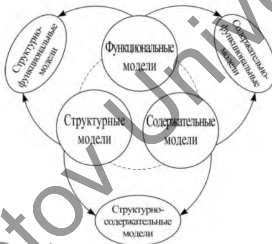
Рисунок 3. Типология педагогических моделей: базовые и производные типы [18]

Учитывая, что ранее нами отмечалась значимость комплексных моделей, мы поддерживаем предложение автора о введении в научный оборот понятий педагогических моделей соответствующих подтипов: структурно-содержательных, структурно-функциональных, функционально-содержательных. Принцип их образования проиллюстрирован на рисунке 3.