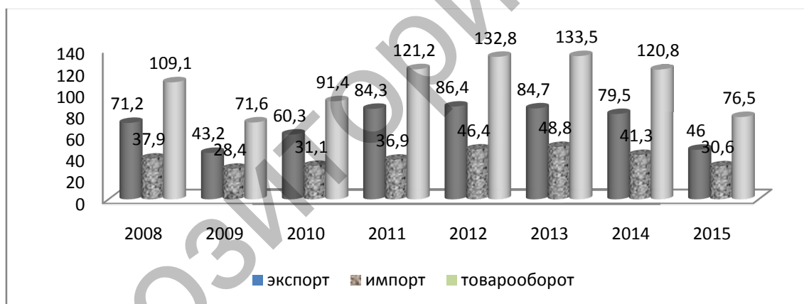
Рисунок 1. Динамика внешнеторгового оборота РК за 2008–2015 гг.

Внешнеторговый оборот Республики Казахстан по итогам 2015 г. составил 76,5 млрд долл. США, снизившись по сравнению с 2014 г. на 36,6 %. Экспорт составил 46 млрд долл. США, снизившись на 42,2 %, а импорт — 30,6 млрд долл. США, снижение составило 26 % (рис. 1).