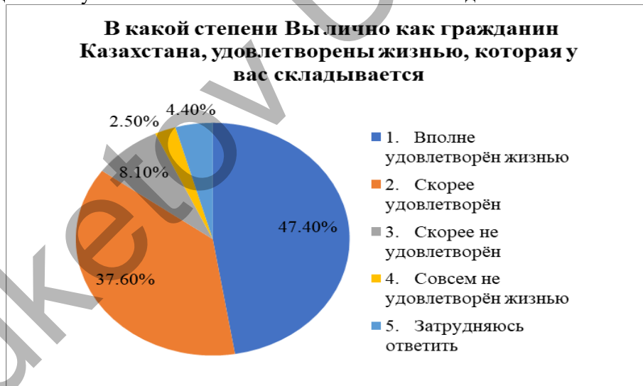
Рисунок 1 – Степень удовлетворенности жизнью опрошенных

Большинство респондентов удовлетворены своей жизнью: «скорее удовлетворены» — 37,6%, «скорее не удовлетворены» — 8,1%, «совсем не удовлетворены» — 2,5%, затруднились ответить — 4,4%. Это свидетельствует о высоком жизненном оптимизме молодежи.