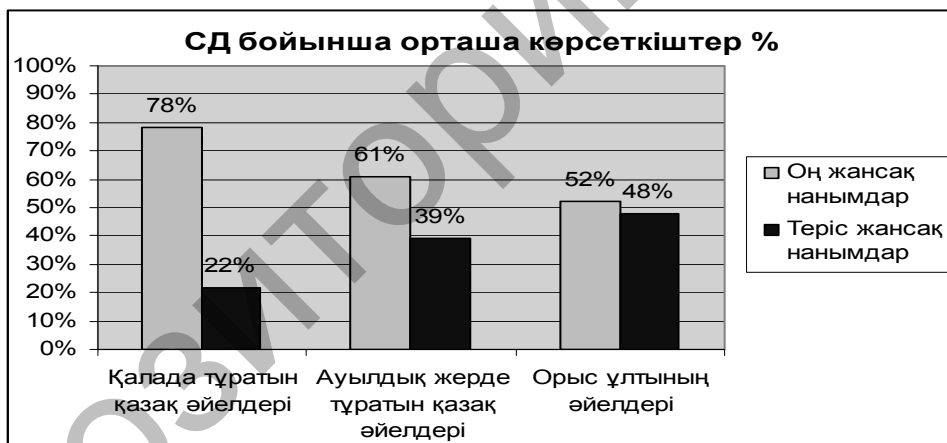
1-сурет. 45–65 жас аралығындағы сыналушылардың мінез-құлық көрінетін жаңсақ нанымдар айырмашылығы

Осы мәселені зерттеуге байланысты үш таңдама алынды. Біріншісі — 45 жастан 65 жасқа дейінгі қалада тұратын қазақ әйелдері, екіншісі — 45 жастан 65 жасқа дейінгі ауылдық жерде тұратын қазақ әйелдері, үшіншісі — 45 жастан 65 жасқа дейінгі орыс ұлтының әйелдері. Үшінші таңдама салыстыру ретінде алынды. Зерттеу үшін тұлғаның этностық жаңсақ нанымдардан туындайтын 23 жағымды және 23 жағымсыз психикалық қасиеттерін белгілейтін Осгудтың өңделген СД әдістемесі қолданылды. Оның нәтижесін төменгі 1-суреттен көруге болады.