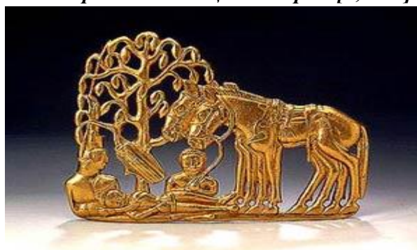
Рисунок 5. Элемент скифо-сакской поясной пряжки. Сибирская коллекция Петра I [2, с.42]

Скифские мастера воплотили эти символы в различных художественных формах - от ювелирных украшений до керамических изделий. Через эти изображения они передавали важные идеи и ценности своего времени, наполняя их эмоциональной силой и динамикой.