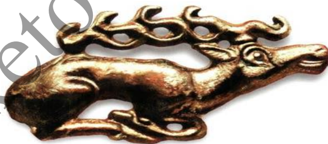
Рисунок 2. Скифский золотой олень. Костромской курган, VI век до н.э. [2, с.38].

Рисунок 3 представляет нам характерный для скифского искусства образ барса, грациозного и сильного хищника. Барс, олицетворяющий ловкость и быстроту, часто изображался в охотничьих сценах, подчеркивая важность охоты в жизни скифов. Его образ, нередко сопровождаемый стилизованными растительными орнаментами или другими животными, создавал сложные композиции, отражающие глубокие верования и представления скифов о мире.