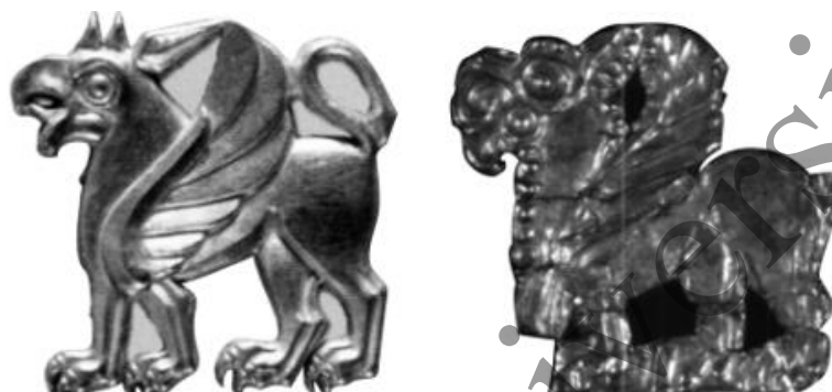
Рисунок 1. Образ грифона. Полнофигурные изображения. Майкопский клад. Сер. V - кон. IV в. до н.э. [2, с.36].

Одним из мифических существ в скифском искусстве был грифон - существо с телом льва и головой орла. Рисунок 1 демонстрирует два варианта изображения скифского грифона - мифического существа, символизирующего власть, охрану и мудрость. В скифской культуре грифон часто выступал хранителем сокровищ и священных мест