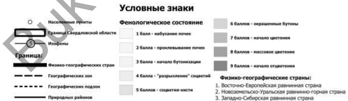
Рисунок. Многолетнее состояние развития черемухи обыкновенной 15 мая

Скорость продвижения явления здесь составляет до 3 баллов/100 км. В Западно-Сибирской средней тайге конфигурация изофен меняется на субширотную и продвижение фронта явления происходит со скоростью 0,7 балла/100 км. Вероятно, определяющим фактором здесь, наряду с широт-