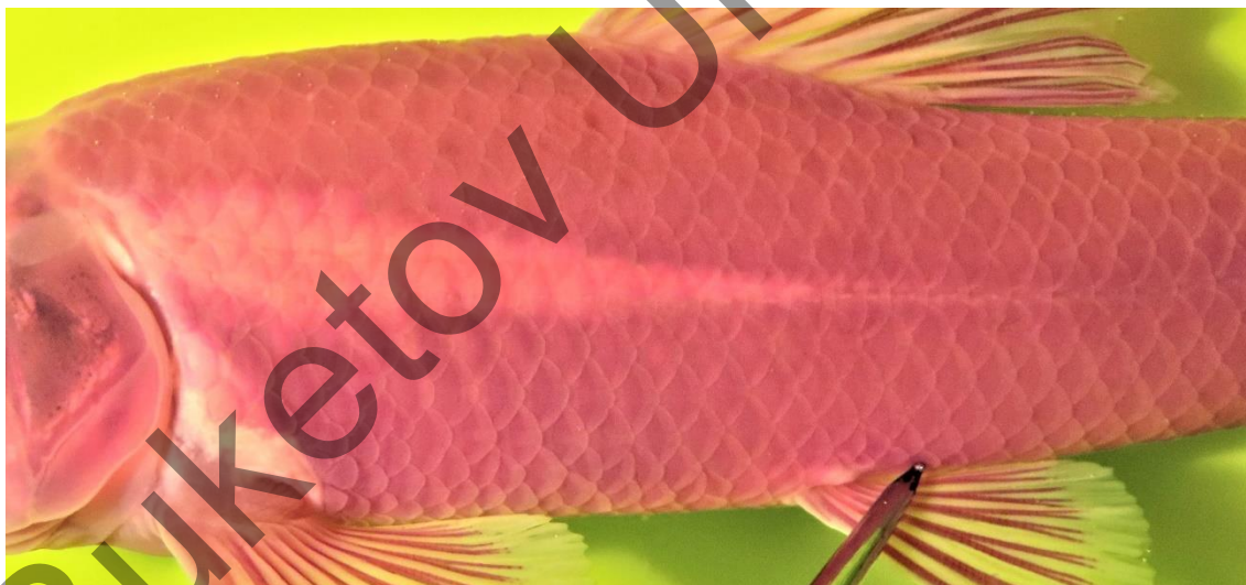
Рисунок 6. Окрашенный чешуйный покров на боку тела речной абботины из р. Каратал (Балхашский бассейн), самка, TL — 92 мм

Чешуи на боках тела и хвостовом стебле довольно крупные, особенно в области боковой линии (рис. 6).