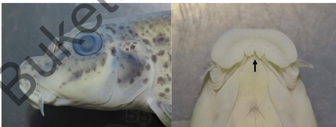
Рисунок 3. Голова речной абботины из р. Каратал (Балхашский бассейн), самка, TL — 91 мм. Слева: вид сбоку; справа: вид снизу на переднюю часть. Стрелкой указана срединная лопасть нижней губы

Длина головы ( lc ) заметно больше H и lpc . Высота головы у затылка значительно больше половины длины lc и, в среднем, равна ширине головы в области предкрышечной кости. Лоб плоский или слегка вогнутый, пространство между ноздрями — выпуклое, круто спускается вниз (мопсообразное рыло) (рис. 3). Рот нижний, маленький, его задние углы достигают вертикали переднего края ноздрей. Верхняя челюсть выдается над нижней. Нижняя губа состоит из трех лопастей — двух широких боковых и узкой срединной. Срединная лопасть, в свою очередь, снизу разделена на две. Глаза расположены высоко. Усики очень короткие, значительно меньше диаметра глаза. В брачный период у самцов по бокам от лучей жаберной перепонки и над верхней губой образуются острые роговые бугорки.