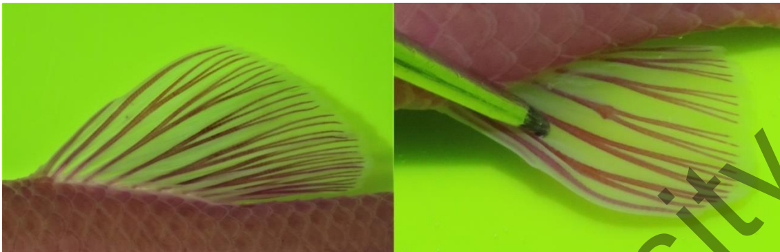
Рисунок 4. Спинной (слева) и анальный (справа) плавники с окрашенными лучами речной абботины из р. Каратал (Балхашский бассейн)

Анальный плавник ( A ) короче спинного, длина основания A меньше его высоты. Угол плавника закругленный, его внешний край обычно прямой, вершина образована 1-м, 1-м и 2-м, либо 2-м и 3-м разветвленными лучами. 1-й неразветвленный луч очень короткий, 2-й не превышает половины длины 3-го неразветвленного луча (рис. 4).