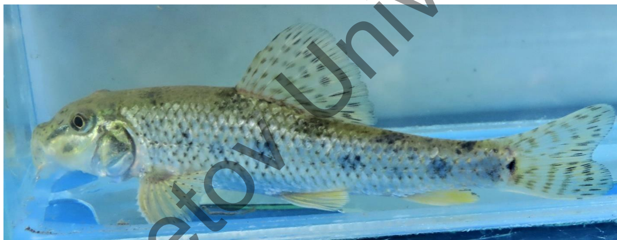
Рисунок 1. Пример прижизненной окраски речной абботины из р. Каратал (Балхашский бассейн)

Окраска. Окраска речной абботины напоминает таковую у пескаря. Из отличий можно отметить менее выраженные очертания пятен на боках тела, которые могут вовсе не проявляться, а также более серебристый фон туловища (рис. 1).