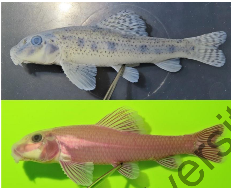
Рисунок 2. Речная абботина из р. Каратал (Балхашский бассейн), самец, TL — 80 мм (особь, фиксированная в формалине). Сверху — естественная окраска, снизу — окрашенная особь

Длина головы ( lc ) заметно больше H и lpc . Высота головы у затылка значительно больше половины длины lc и, в среднем, равна ширине головы в области предкрышечной кости. Лоб плоский или слегка вогнутый, пространство между ноздрями — выпуклое, круто спускается вниз (мопсообразное рыло) (рис. 3). Рот нижний, маленький, его задние углы достигают вертикали переднего края ноздрей. Верхняя челюсть выдается над нижней. Нижняя губа состоит из трех лопастей — двух широких боковых и узкой срединной. Срединная лопасть, в свою очередь, снизу разделена на две. Глаза расположены высоко. Усики очень короткие, значительно меньше диаметра глаза. В брачный период у самцов по бокам от лучей жаберной перепонки и над верхней губой образуются острые роговые бугорки.