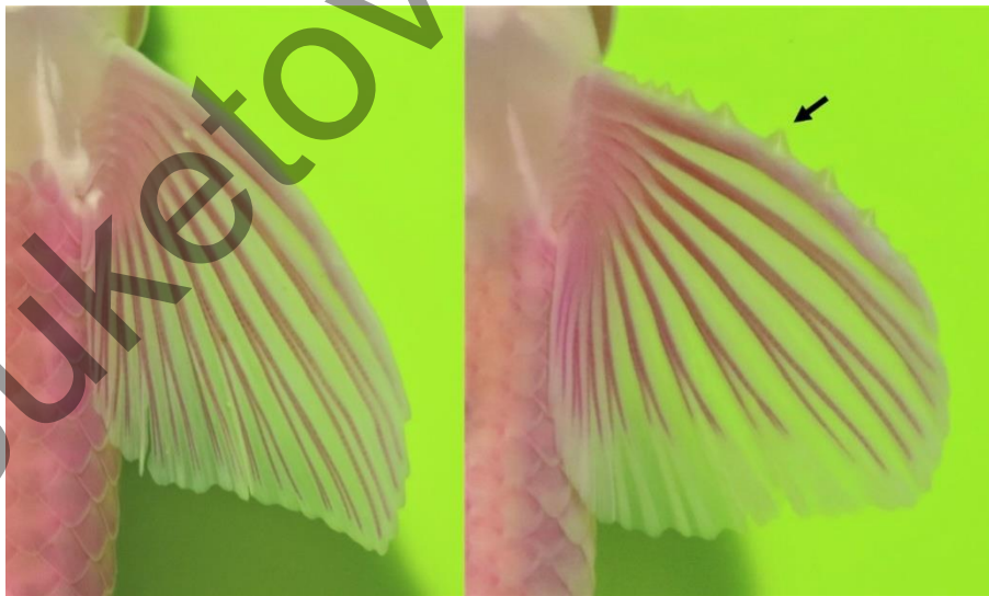
Рисунок 5. Левый грудной плавник с окрашенными лучами речной абботины из р. Каратал (Балхашский бассейн). Слева: самка, TL — 91 мм; справа: самец, TL — 80 мм. Стрелкой указан брачный бугорок на неветвистом луче

Грудные плавники ( P ) занимают 71–86 % (в среднем 82 %) пекто-вентрального расстояния ( P – V ). Форма P индивидуально изменчива, концы плавника заостренные или тупые, реже округлые, задний край прямой, либо вогнутый (правый и левый плавники могут различаться), концы лучей часто не связаны плавниковой перепонкой. Вершина P обычно заканчивается на 2-м и 3-м разветвленных лучах, иногда только на 2-м. Неразветвленный луч не достигает вершины 1-го разветвленного луча. У самцов на неразветвленном луче в брачный сезон образуются острые бугорки (рис. 5).