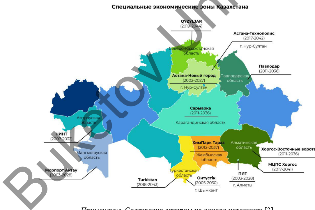
Примечание. Составлено автором на основе источника [3].

Как правило, СЭИИЗ — это географическая зона, которая в некоторой степени изолирована [2; 52]. Юридическое значение СЭИИЗ определяется действующим законодательством (рис.1)[3; 33].