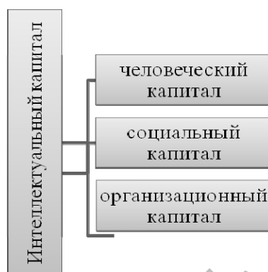
Рисунок 2 - Составляющие интеллектуального капитала

Наличие универсальных, квалифицированных и опытных специалистов является главным критерием создания новых разработок в многообразии диапазонов областей и современного производства. Знания позволяет функционировать как умственному, так и физическому труду.