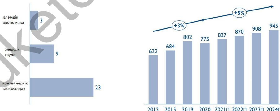
1-сурет. Әлемдік экономиканың, сауданың және контейнерлік тасымалдау, 2012 – 2024 жж[4]

Жаһандық контейнерлік тасымалдардың өсу қарқыны бірнеше рет әлемдік экономика мен сауданың өсу қарқынынан асып түседі.